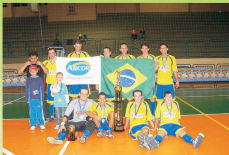
Costa e Fischer Bicampeã

Campeão Costa e Fischer. Criando integração da classe comercial nas comemorações dos 75 anos do SECJ, a competição aconteceu em várias semanas com todas as rodadas realizadas nas quadras do ginásio do Sesc. O campeonato de 2005 de futsal dos comerciários contou com 14 equipes, em 34 jogos distribuídos em 10 rodadas, além de ter a arbitragem por conta da Liga Joinvilense de futsal e a co-promoção com o Sesc Joinville.