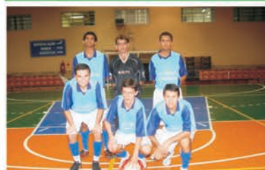
4º lugar: Correios Americ.