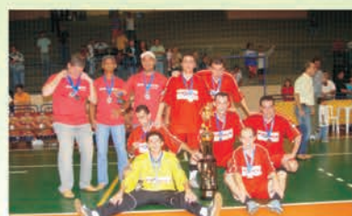
2º lugar: Beber/Kakuete