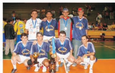
3º lugar: Superm. Soares